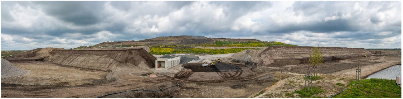
Abbildung 2 Zentraldeponie Cröbern

Auf der Zentraldeponie Cröbern wurden im Jahr 2021 folgende Abfälle entsorgt: