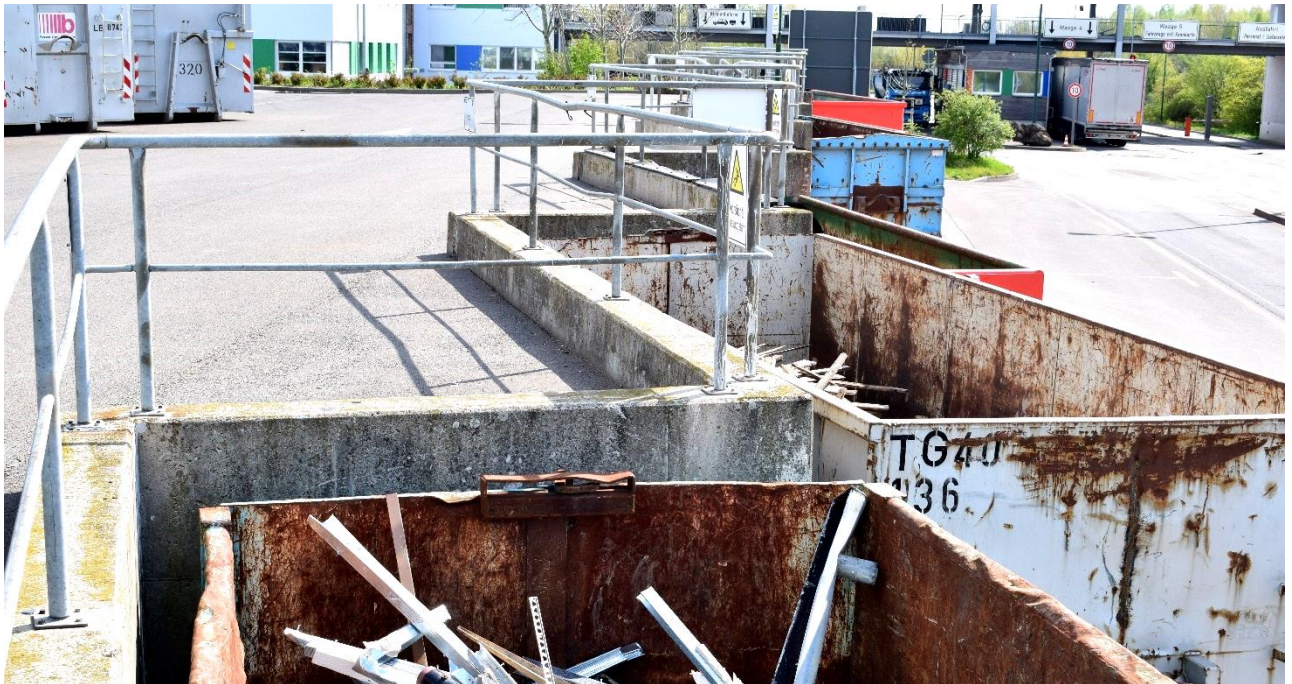
Abbildung 3 Kleinanliefererbereich Cröbern

Die im Kleinanliefererbereich angenommenen Mengen stellen sich wie folgt dar: