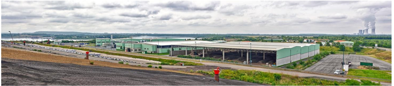
Abbildung 1 Mechanisch-Biologische Abfallbehandlungsanlage (MBA) Cröbern

Die in der MBA verarbeiteten Abfälle stellen sich wie folgt dar: