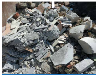
SONST. MINERALISCHE ABFÄLLE

i Bitte beachten Sie, dass Asbest stets in Folie oder speziellen BigBags luftdicht verpackt angeliefert und in den entsprechenden Container eigenständig entladen werden muss.