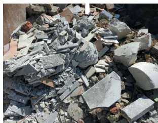
SONST. MINERALISCHE ABFÄLLE

i Bitte beachten Sie, dass Asbest stets in Folie oder speziellen BigBags luftdicht verpackt angeliefert und in den entsprechenden Container eigenständig entladen werden muss.